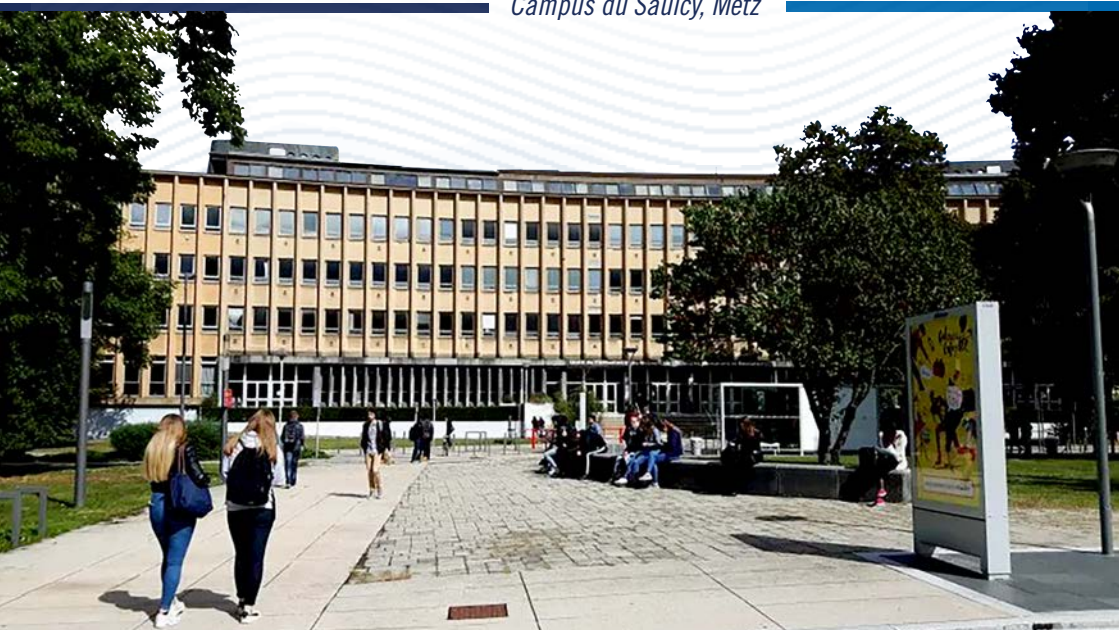
Campus du Saulcy, Metz