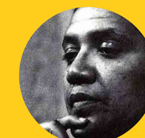
Audre Lorde (poétesse et militante lesbienne afro-américaine, 1934-1992)