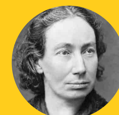
Louise Michel (militante française de la Commune, 1830-1905)