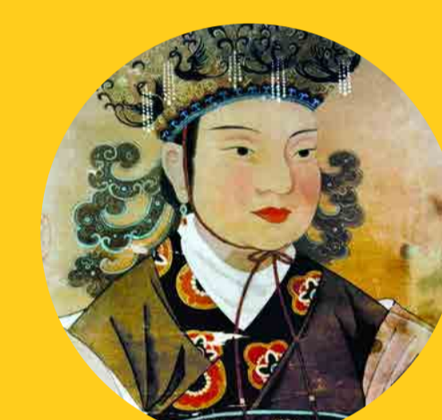
Wu Zetian (Impératrice de Chine, 624-705)