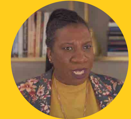
Tarana Burke (militante américaine ayant notamment lancé Me too en 2007, 1973-)