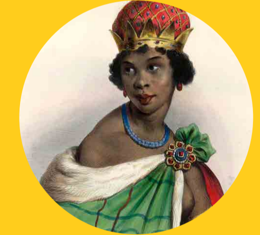
Nzinga (Reine du Ndongo et du Matamba dans l'actuel Angola, 1583-1663)