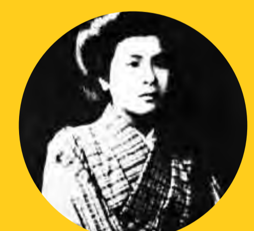
Ito Noé (journaliste, militante féministe anarchiste japonaise, 1895-1923)