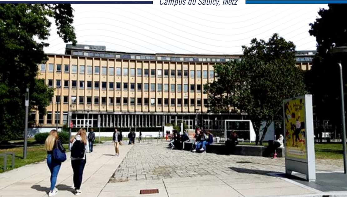
Campus du Saulcy, Metz